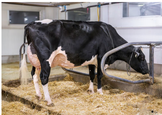
DUBENOIT MONTEVERDI EVELY DAM